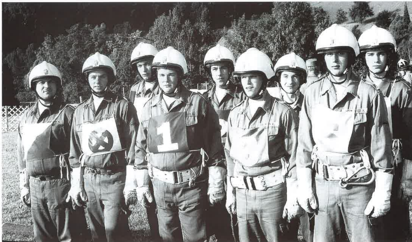
13. Juni 1999: Löschgruppenbewerb Abschnitt Weyer in Losenstein.