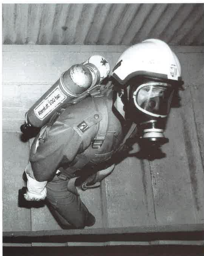
28. September 1999: Atemschutzübung im Lagerhaus Wolfern.