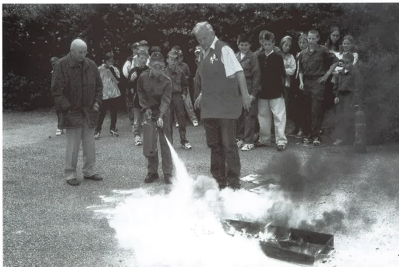
11. Juni 1999: Zivilschutzübung beim Feuerwehrhaus.