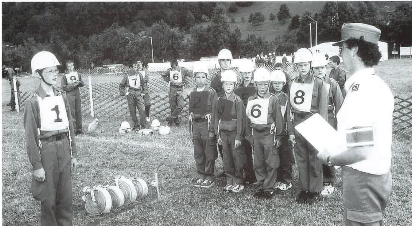
12. Juni 1999: Jugendleistungsbewerb Abschnitt Weyer in Losenstein.